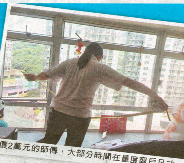
報價2萬元的師傅，大部分時間在量度窗戶尺寸。

政府在2012年6月推行「強制驗樓驗窗」計劃，要求樓齡30年或以上的樓宇驗樓，及樓齡10年的樓宇驗窗。屋宇署原計劃每季選出950幢樓齡10年以上的樓宇驗窗，即每年約有17萬戶住宅要依法為寓所驗窗。業內人士估算，計劃催生出每年逾十億元的驗窗生意。不過，本報發現業內亂象叢生，不少蠱惑公司出盡招數謀財，業主隨時花4倍冤枉錢。