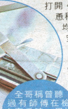
全哥稱曾聽過有師傅在檢查窗戶時，用螺絲批撬爛窗鉸，再要業主換窗。

舊，要全部更換手掣、窗鉸，並要做全屋6幅窗框與外牆的防漏工程。整個檢查過程約20分鐘，師傅全程花最多時間在量度窗戶尺寸，和數窗戶數目，部分窗戶更未被打開。期間，師傅又不斷敷衍稱，「十年驗一次，平均每年千幾蚊咁；住得安心嘛！」最終師傅報價為20,324元，當中包括約8,000元更換全部窗戶的窗鉸、手掣、膠邊、逾萬元的全屋防漏工程，以及向屋宇署證明驗窗合格的證書和行政費用。